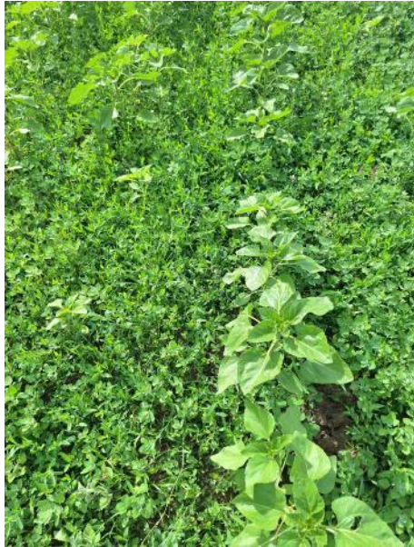
Снимка 4 Нетретирана контрола