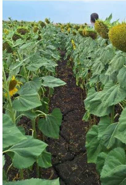
Снимка 4 Ефикасност 28 DAT вариант 6. Стомп Аква 3.5 L/ha + Пулсар плюс 1.6 L/ha.