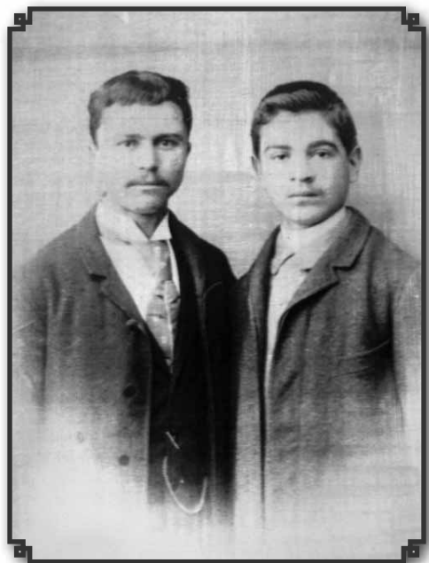
Прил. 2.