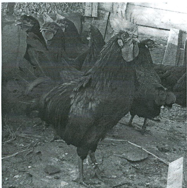
Фиг. 1. Развъдна група от породата Черна шуменска кокошка на възраст 4,5 месеца